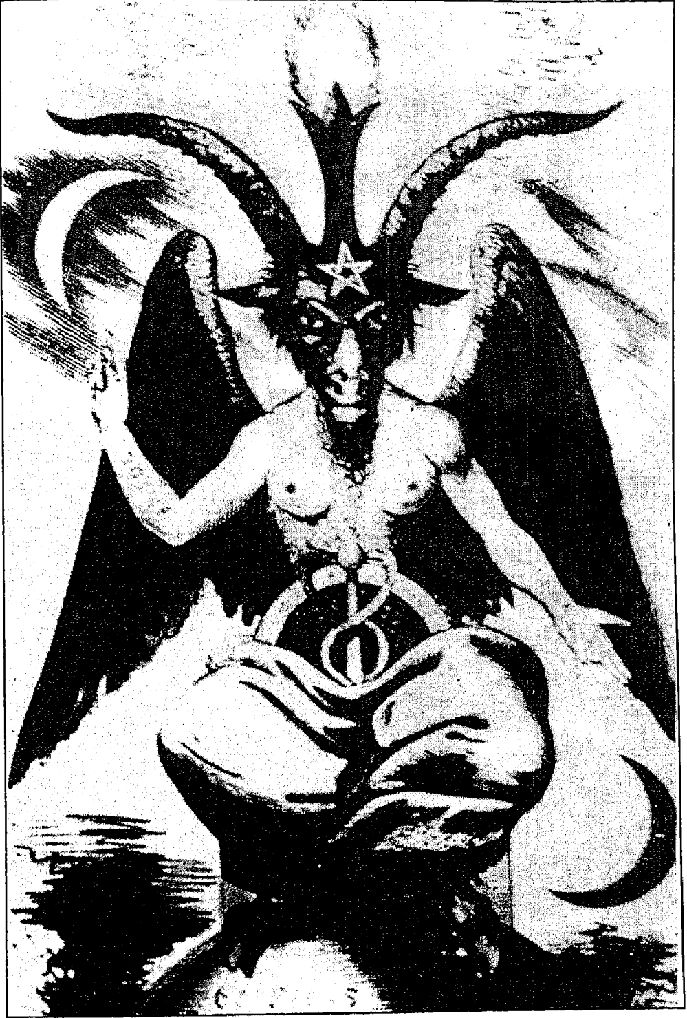
الشیطان .. صورة من خیال رسام فی القرن ۱۵م